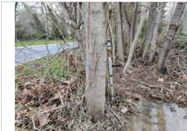
Arbre proche du poste