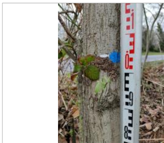
Trace sur l'écorce

Altitude calculée de l'eau (en m) : 11.1