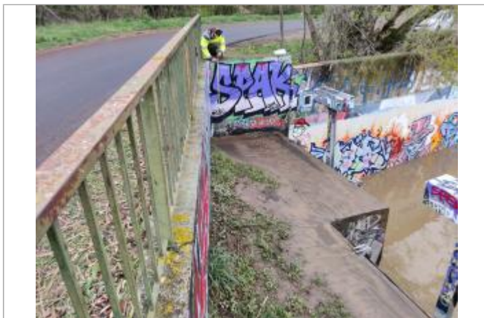
Maçonnerie de l'exutoire