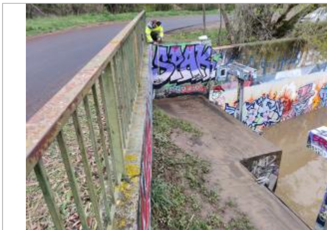
Maçonnerie de l'exutoire

Coordonnées WGS84 : X: 3.23145870 / Y: 43.32772790