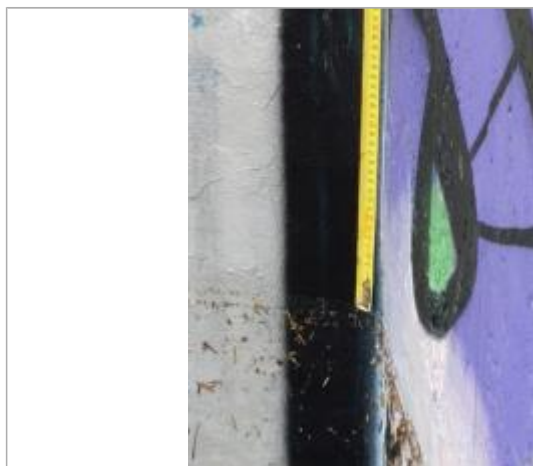
Trace sur l'ouvrage