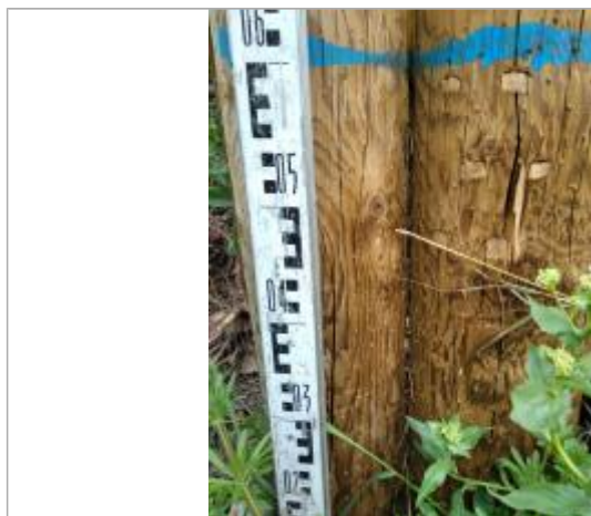
Trace sur le pylône