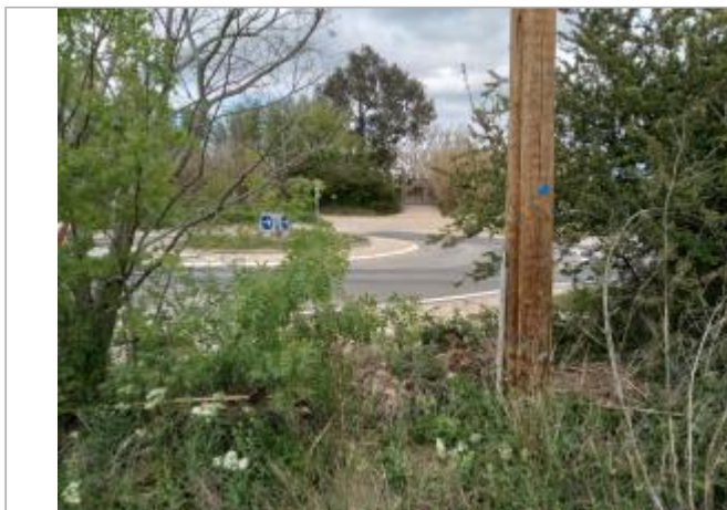
Pylône en bois