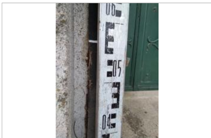
Trace sur le joint du portail