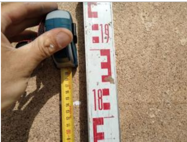
Trace sur le mur

Altitude calculée de l'eau (en m) : 9.516