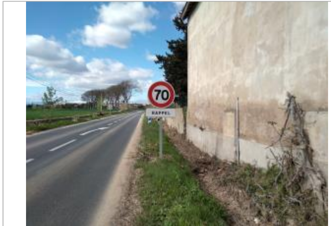
Mur de maison

Coordonnées WGS84 : X: 3.22738890 / Y: 43.31875870