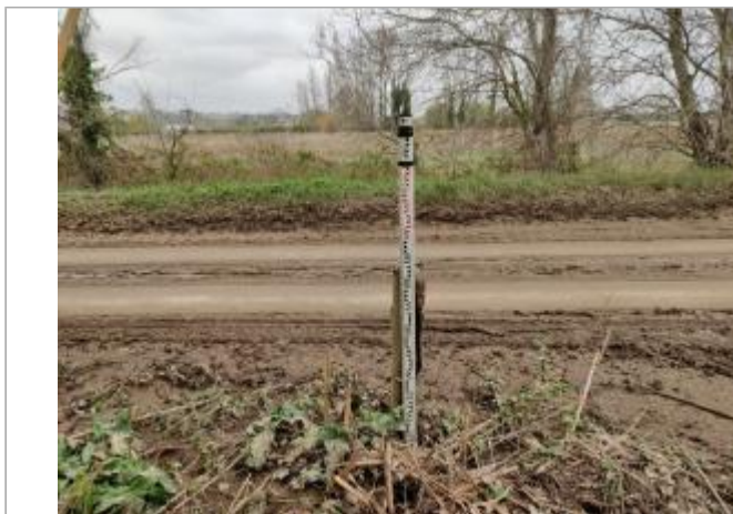
Poteau en bois