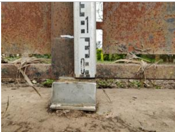
Trace sur le portail

Altitude calculée de l'eau (en m) : 8.079