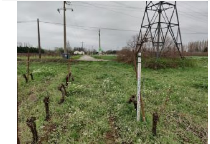
Piquet de tête

Coordonnées WGS84 : X: 3.24032320 / Y: 43.32143850