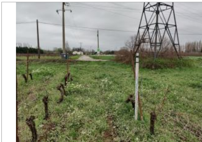
Piquet de tête