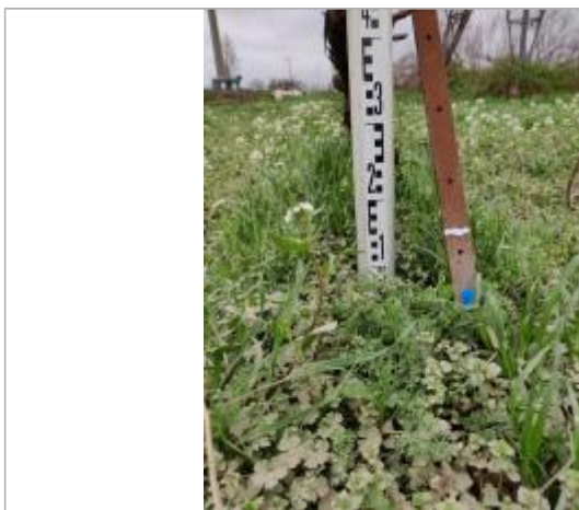
Trace sur le piquet