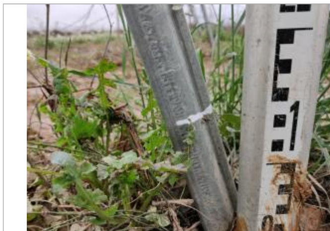
Trace sur le piquet