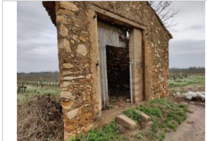
Mur du Mazet

Coordonnées WGS84 : X: 3.25179160 / Y: 43.30107290