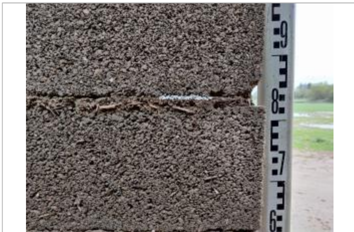
Trace sur le mur