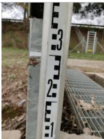
Trace sur le guide du batardeau