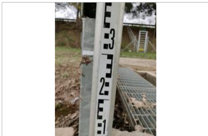
Trace sur le guide du batardeau