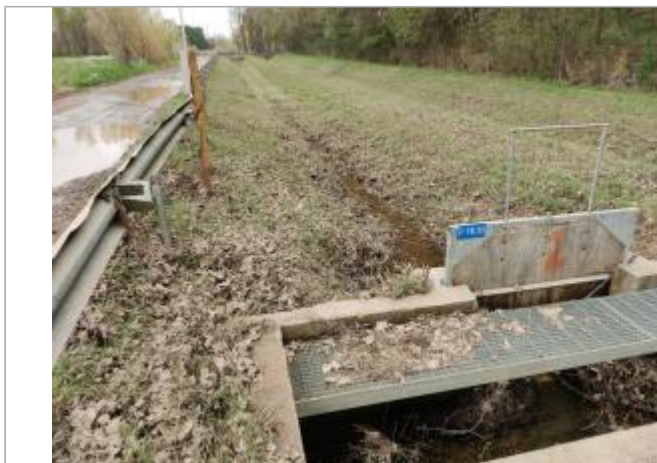
Martelière assainissement pluvial

Coordonnées WGS84 : X: 3.26032710 / Y: 43.31715510