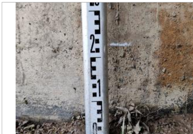
Trace sur la culée