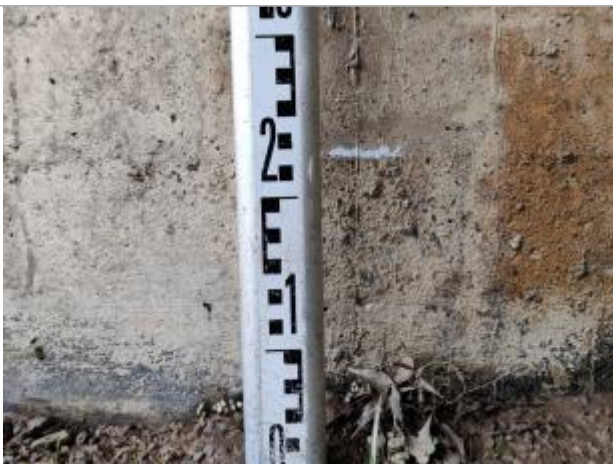
Trace sur la culée