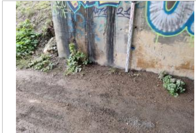
Culée de pont

Coordonnées WGS84 : X: 3.26175580 / Y: 43.31761050