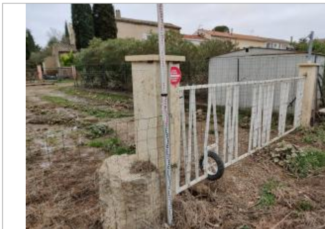
Montant de portail

Coordonnées WGS84 : X: 3.25984340 / Y: 43.29648400