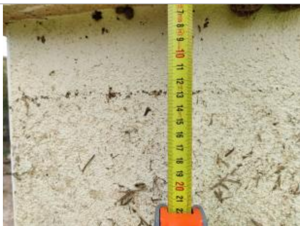
Trace sur le montant

Altitude calculée de l'eau (en m) : 6.58