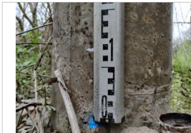
Trace sur le poteau