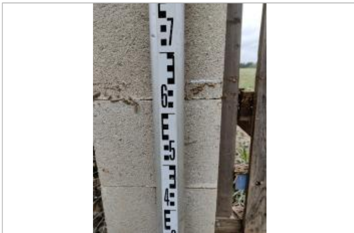
Trace sur le montant béton