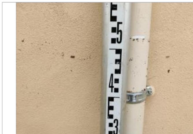
Trace sur la gouttière

Altitude calculée de l'eau (en m) : 6.38