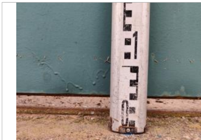
Trace sur le portail

Altitude calculée de l'eau (en m) : 6.334