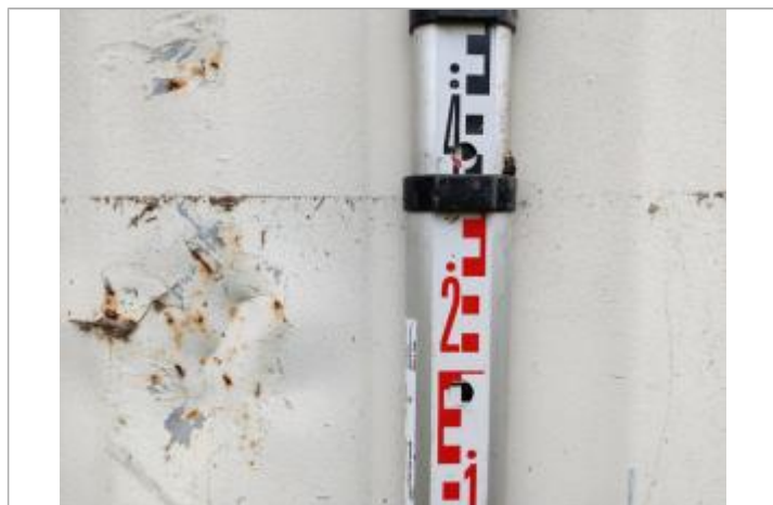
Trace sur le container

SOURCE DE REPÉRAGE : LAISSES DE CRUES RELEVÉES PAR OTEIS SUR LA VALLÉE DE L'ORB - 13/03/2022