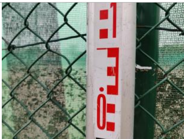
Trace sur le piquet

Altitude calculée de l'eau (en m) : 6.292