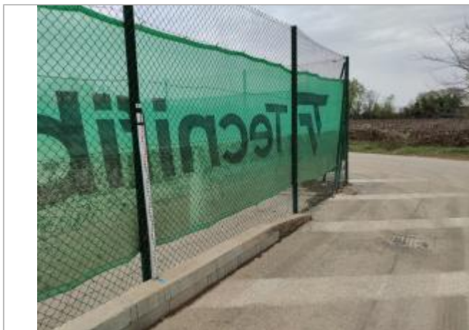
Clôture du cours