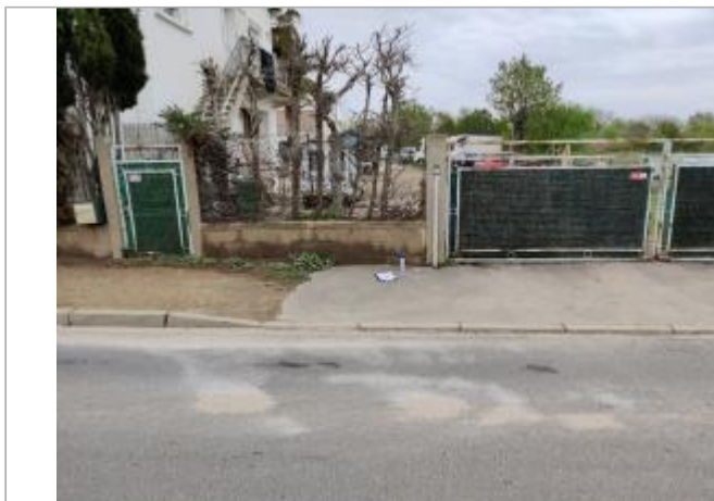
Montant du portail

Coordonnées WGS84 : X: 3.26751910 / Y: 43.29127480