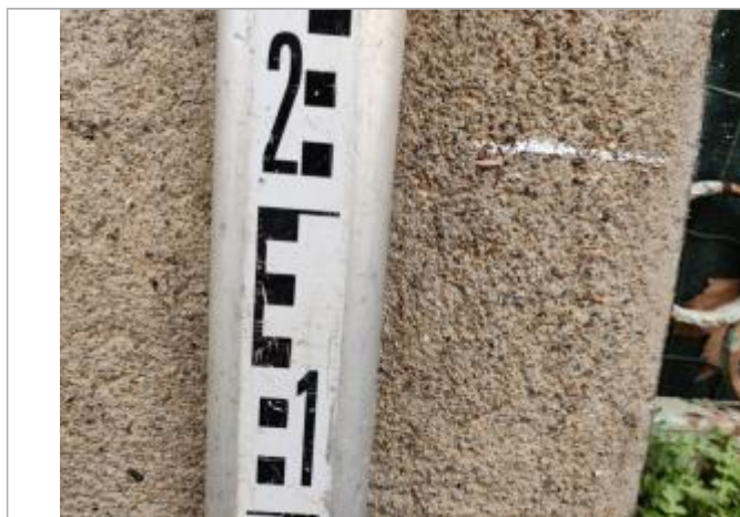
Trace sur le montant

Altitude calculée de l'eau (en m) : 6.17