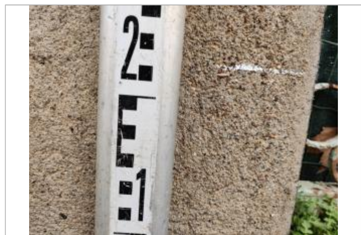
Trace sur le montant

GÉNÉRAL Code : 23_ORB22_R_166_1 Date de mise à jour : 26/04/2023 Auteur : SPC MO