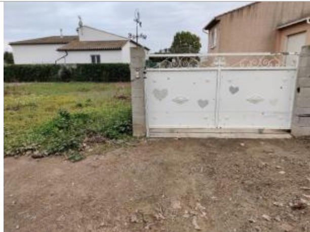
Montant du portail