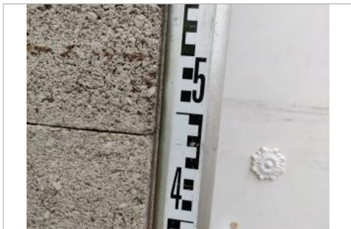
Trace sur le montant

Altitude calculée de l'eau (en m) : 6.191