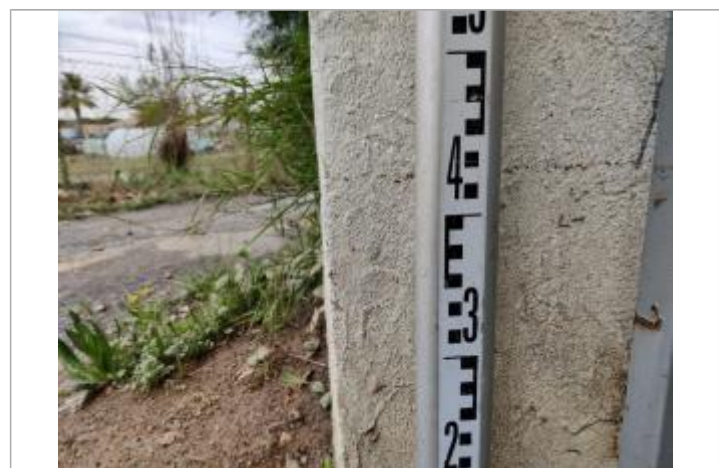
Trace sur le montant

GÉNÉRAL Code : 23_ORB22_R_163_1 Date de mise à jour : 26/04/2023 Auteur : SPC MO