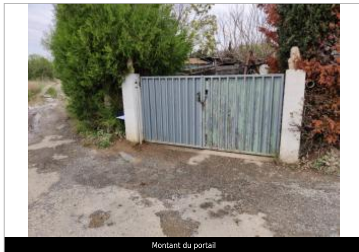
Montant du portail

GÉOLOCALISATION Coordonnées WGS84 : X: 3.26803010 / Y: 43.29099470 Coordonnées RGF93 (Lambert 93) X: 721765.1 / Y: 6243573 Coordonnées RGF93 (ETRS89) : X: 3.2680301 / Y: 43.2909947 Code Hydro: Y25-0400 Rive de référence: Droite