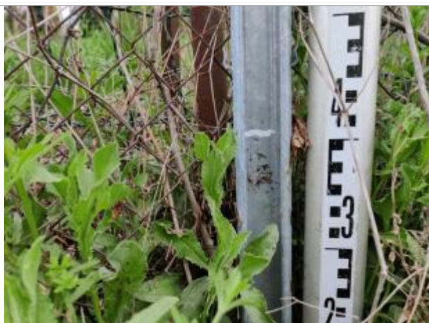
Trace sur un piquet de clôture

Altitude calculée de l'eau (en m) : 6.128