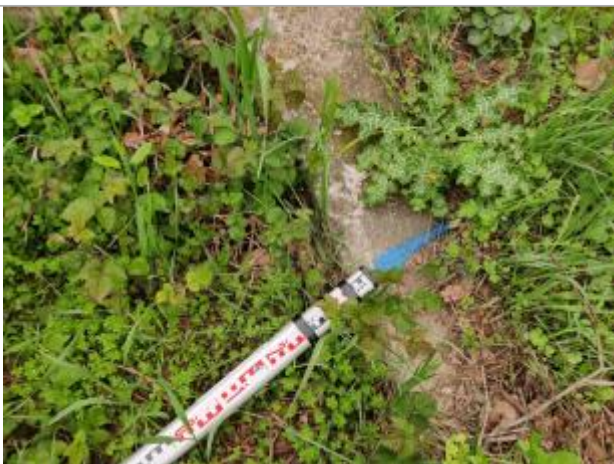
Trace sur l'ouvrage

Altitude calculée de l'eau (en m) : 5.807