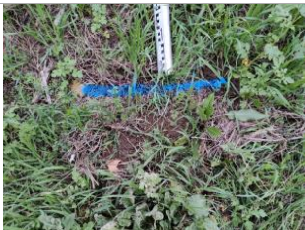
Dépôt contre la digue