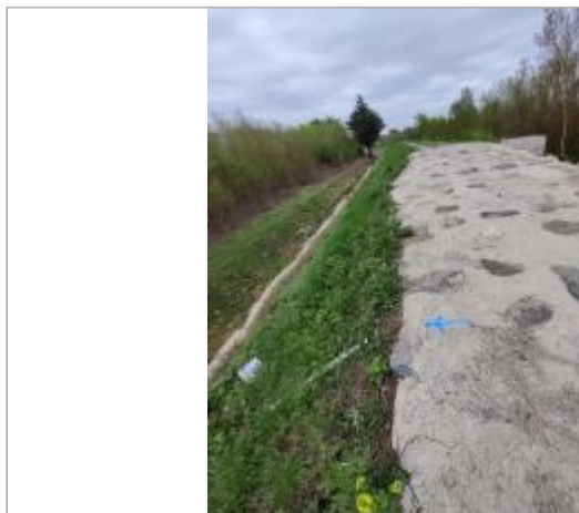
Talus de digue