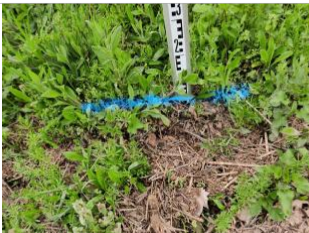
Dépôt contre le talus