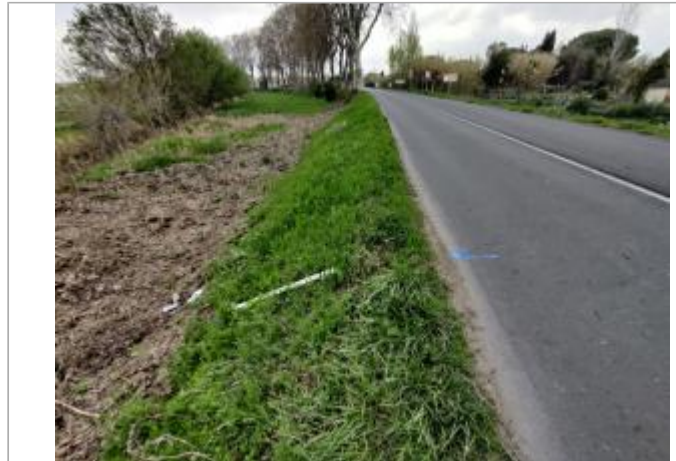
Talus de route

Coordonnées WGS84 : X: 3.27983760 / Y: 43.31006270