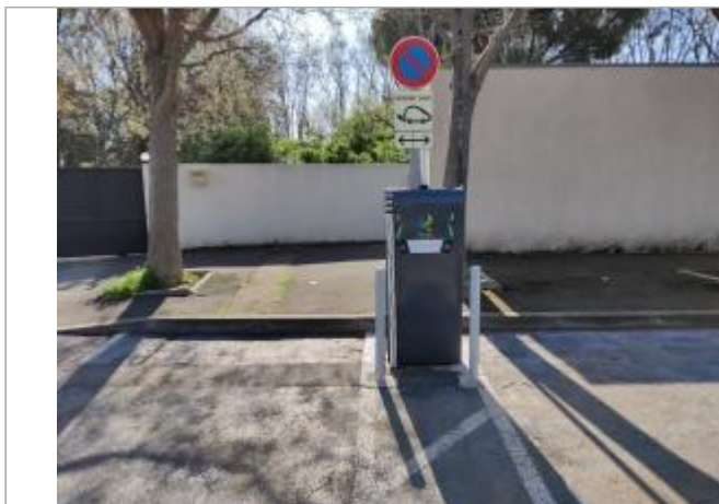
Borne de recharge