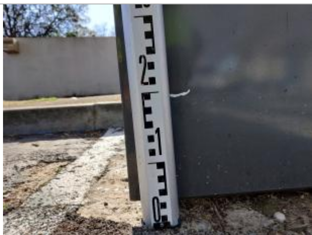
Trace sur la borne

Altitude calculée de l'eau (en m) : 5.57