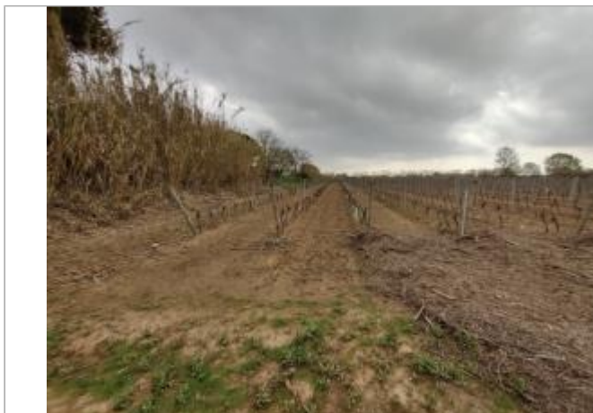
Piquet de tête