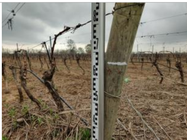
Trace sur le piquet de tête

Altitude calculée de l'eau (en m) : 5.512