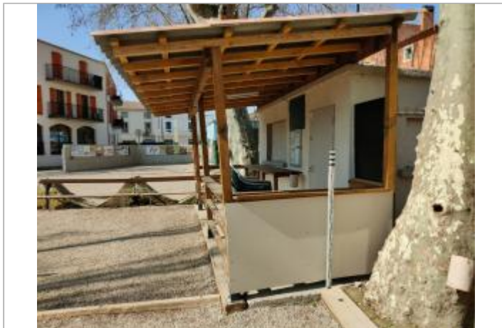
Comptoir de la buvette