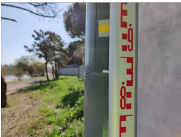
Trace sur le poteau

Altitude calculée de l'eau (en m) : 5.04