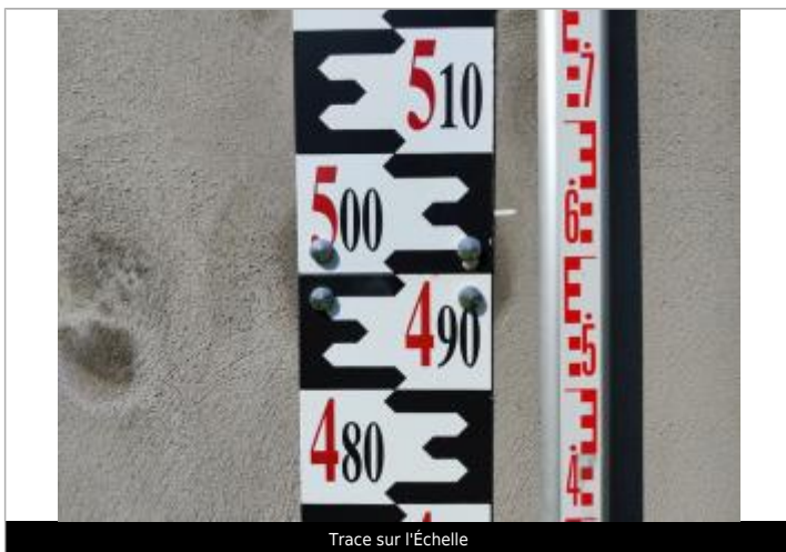
Trace sur l'Échelle

Altitude calculée de l'eau (en m) : 5.01