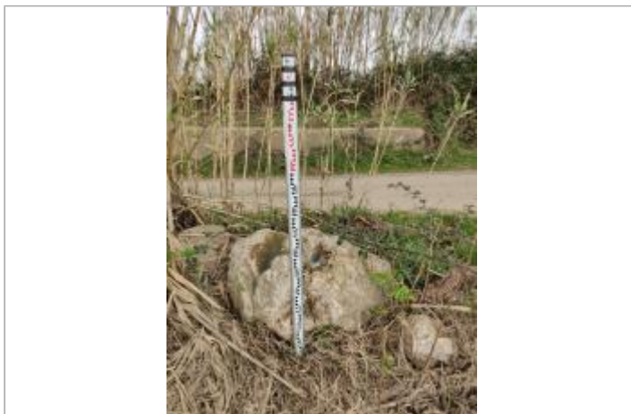
Rocher en bord de chemin