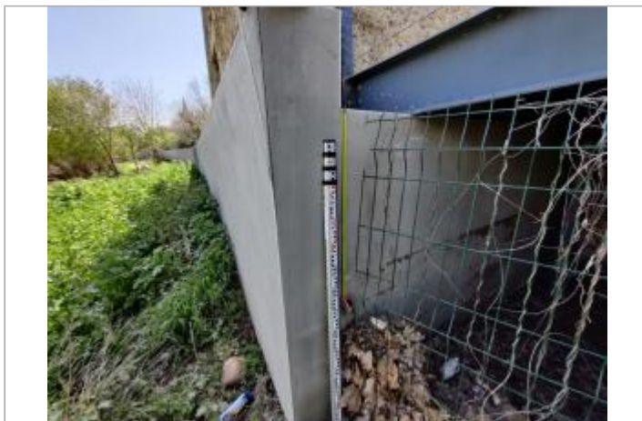
Mur de soutènement, passerelle piétonne