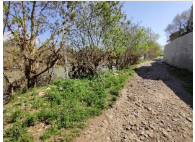
Arbre de berge