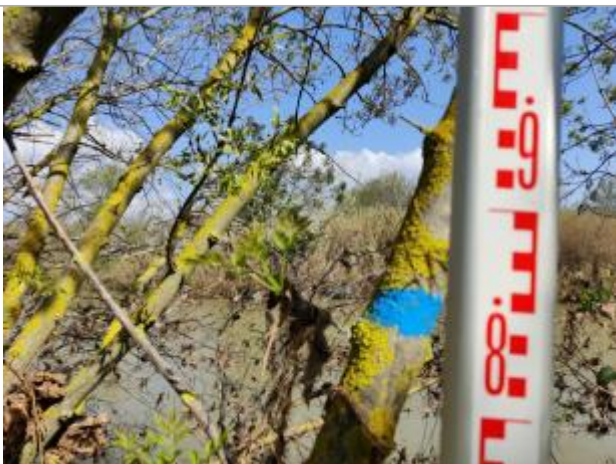
Débris végétaux sur l'arbre