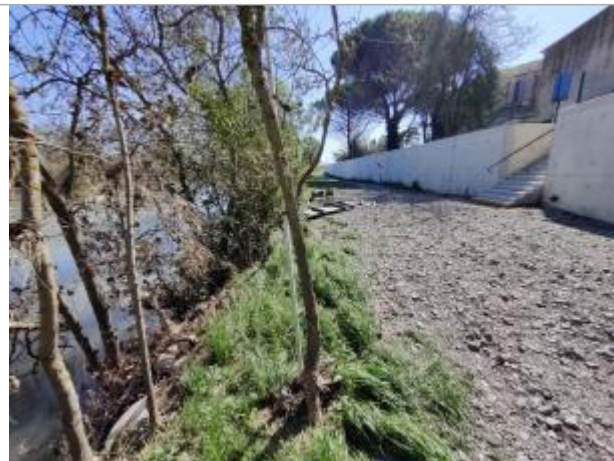
Arbre de berge