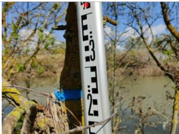
Débris végétaux sur l'arbre

Altitude calculée de l'eau (en m) : 4.66