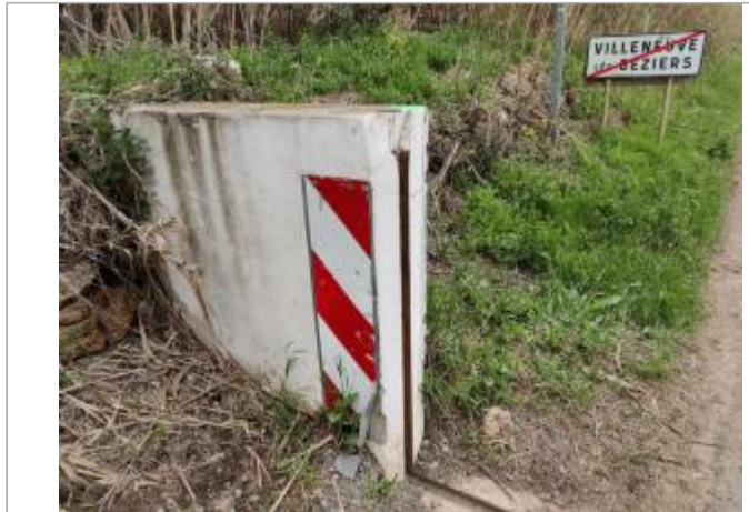
Culée de batardeau

Coordonnées WGS84 : X: 3.28310430 / Y: 43.31101670