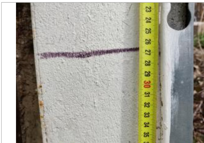
Marque sur la culée

Altitude calculée de l'eau (en m) : 4.632