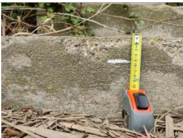
Trace de limon sur les marches

Altitude calculée de l'eau (en m) : 4.562