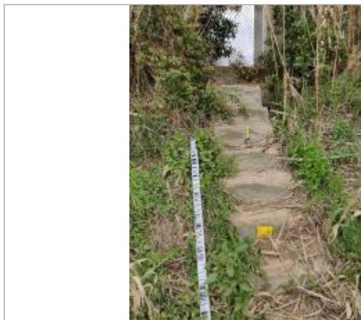
Escaliers de digue

Coordonnées WGS84 : X: 3.28170180 / Y: 43.30937420