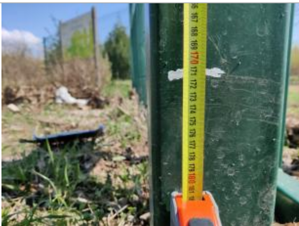
Trace sur le portail

Altitude calculée de l'eau (en m) : 4.451