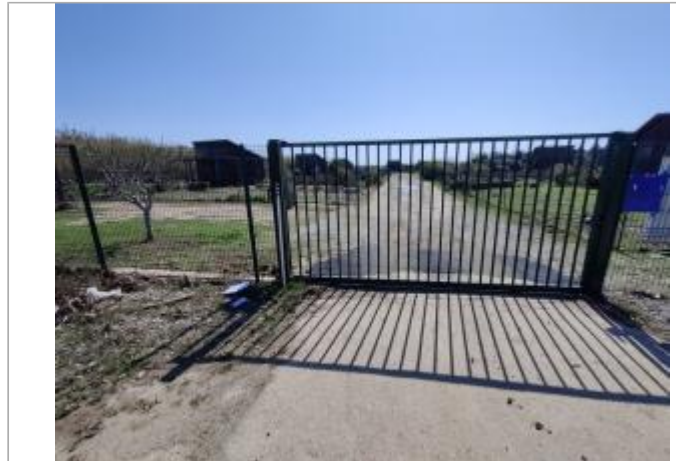
Portail d'entrée - Jardins partagés

Coordonnées WGS84 : X: 3.28787330 / Y: 43.28022990