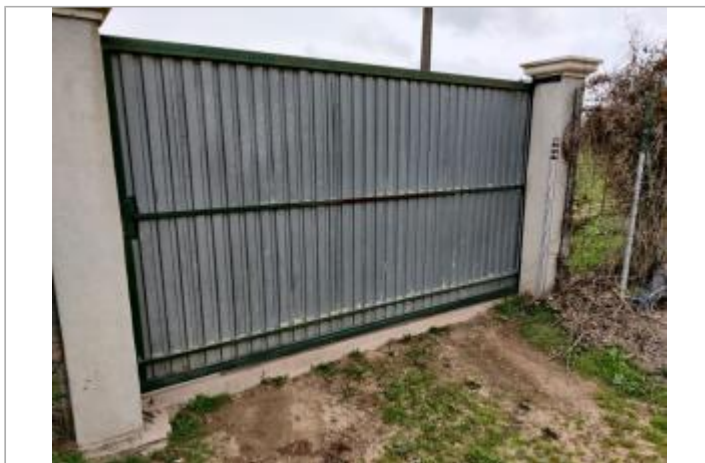
Montant de portail