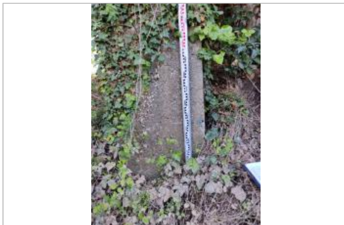
Culée béton d'ancienne passerelle