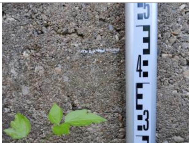
Trace sur la culée

Altitude calculée de l'eau (en m) : 4.38