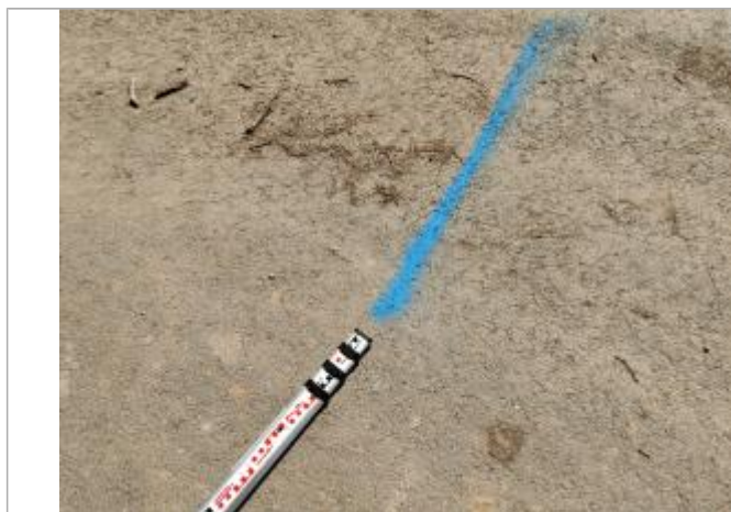
Dépôt sur la chaussée