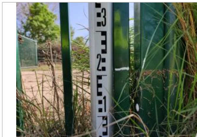
Trace sur le portillon