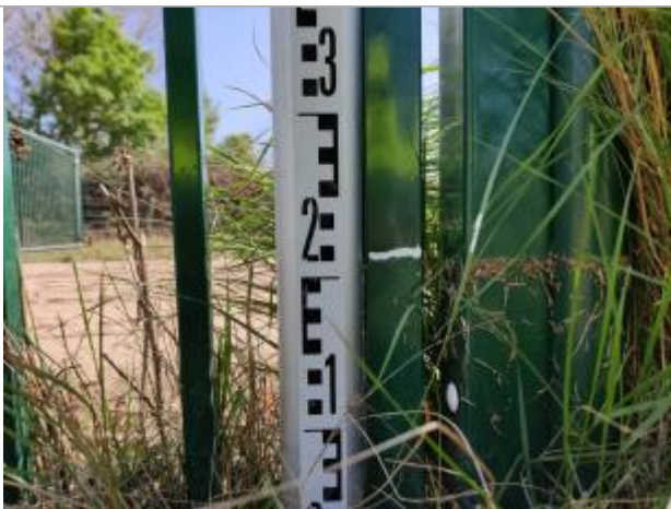
Trace sur le portillon

Altitude calculée de l'eau (en m) : 4.099