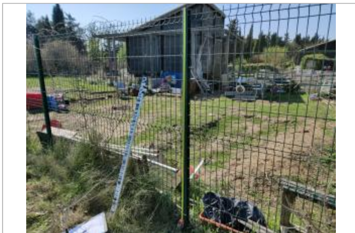
Piquet de clôture