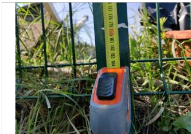
Trace dans le profilé