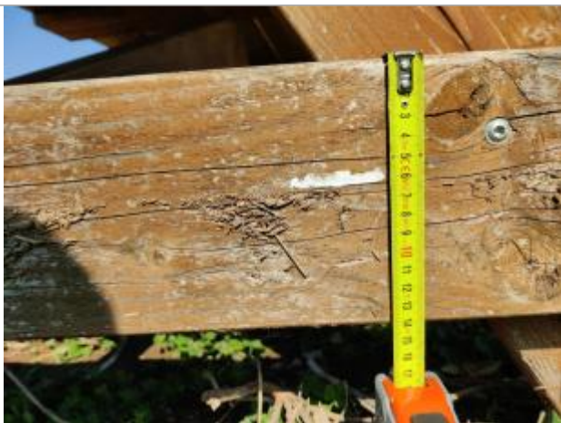
Trace sur la poutre de traverse

Altitude calculée de l'eau (en m) : 3.739