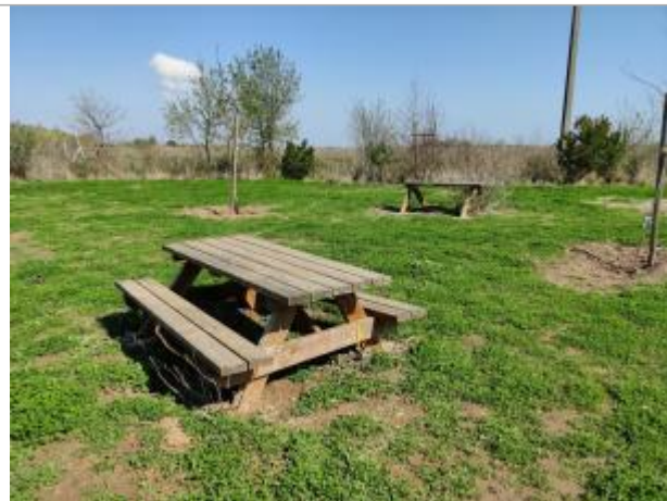
Table de pique-nique