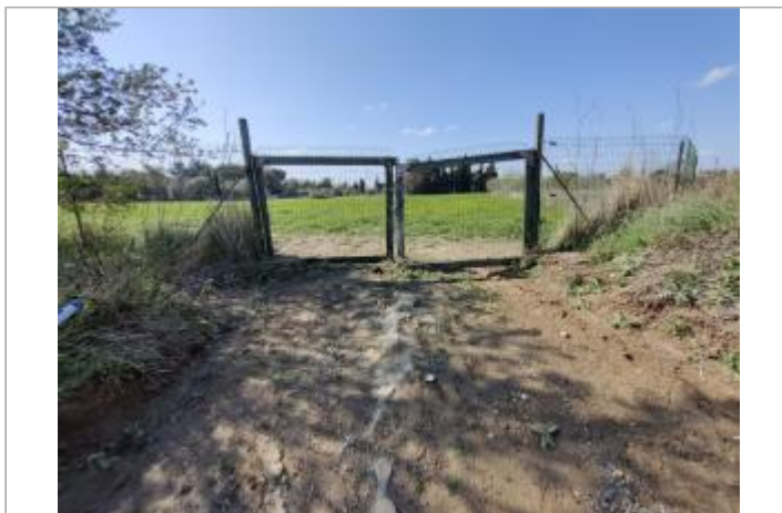
Piquet de clôture