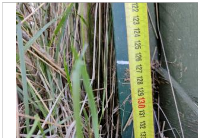
Trace sur la cornière