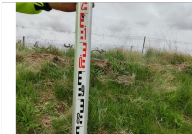
Dépôt contre le talus

Altitude calculée de l'eau (en m) : 3.655