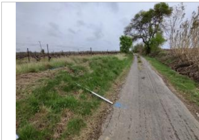
Talus en bord de chemin