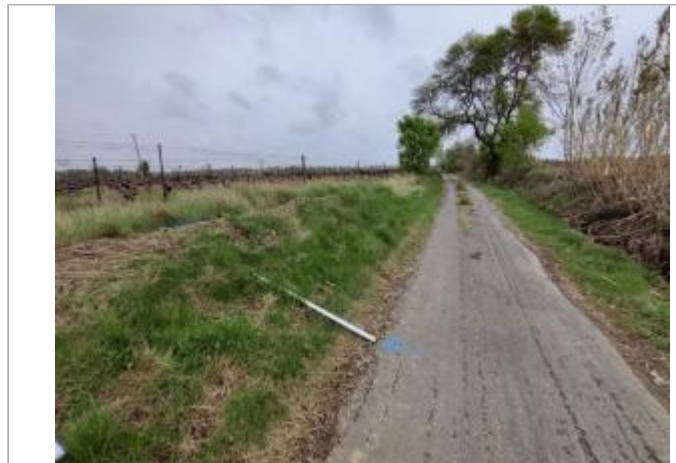
Talus en bord de chemin

Coordonnées WGS84 : X: 3.29569810 / Y: 43.30766360