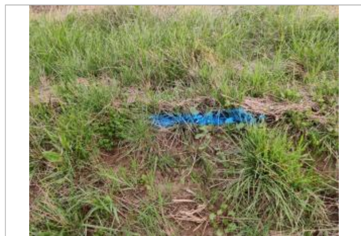
Dépôt contre le talus