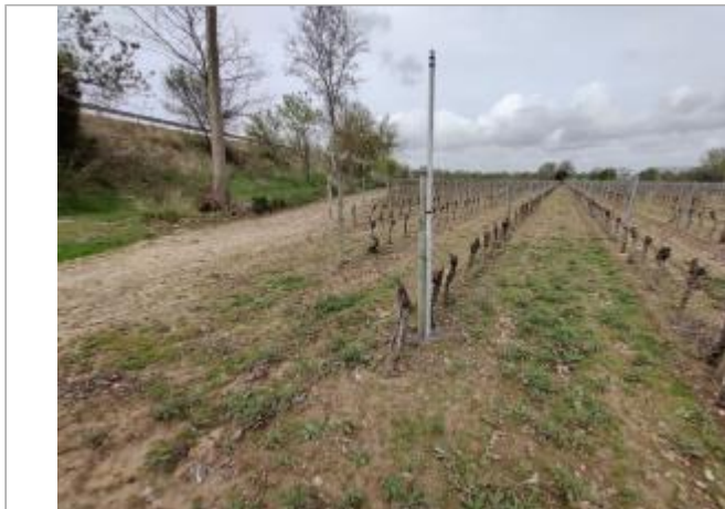
Piquet de tête

Coordonnées WGS84 : X: 3.29419280 / Y: 43.31346100