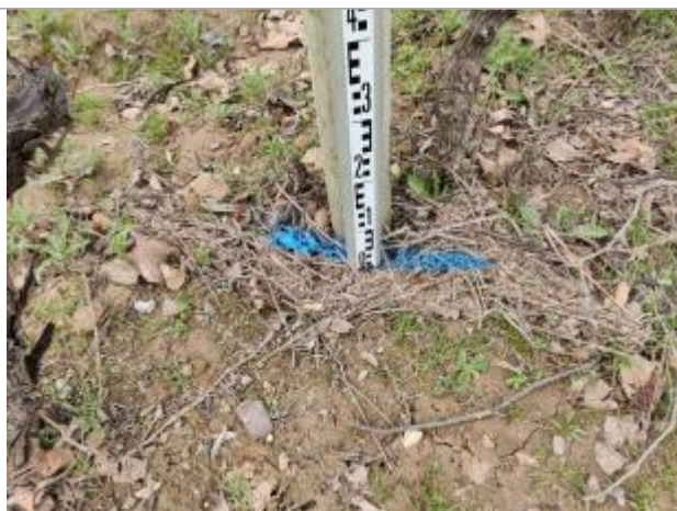
Dépôt contre le piquet