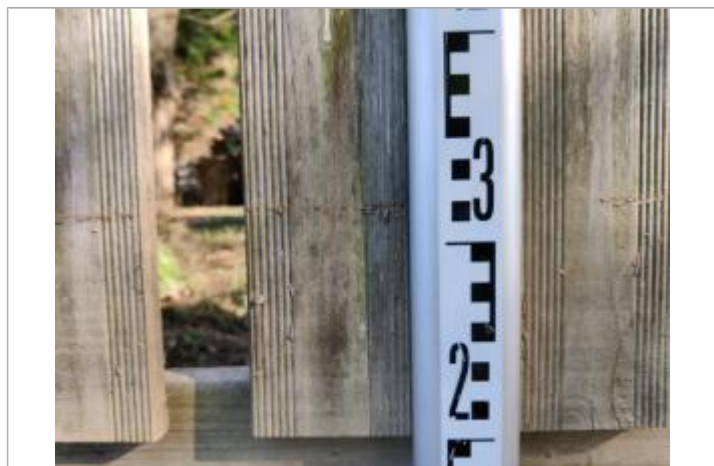
Trace sur les lames de bois

Altitude calculée de l'eau (en m) : 3.01