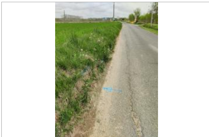
Talus bord de route