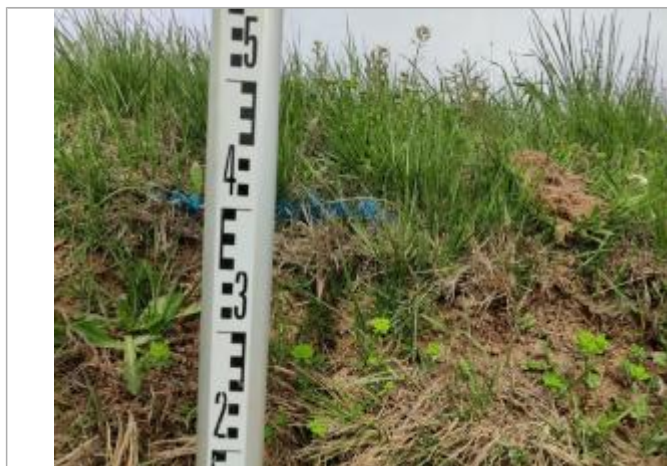
Dépôt contre le talus

Altitude calculée de l'eau (en m) : 2.947